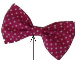
この布は適当に裁断して～